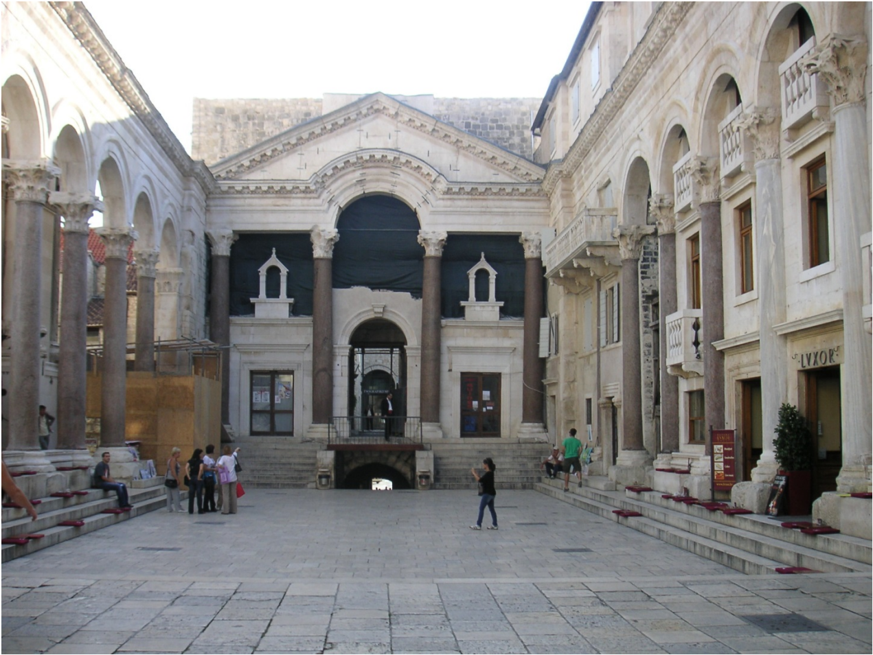
Abbildung 1: Der Diokletianspalast in Split