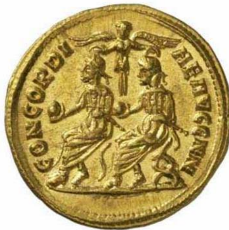
Abbildung 7: RIC V/2, S. 290, N. 601 (Münzstätte Cyzicus, ca. 293 n.Chr.) bietet eine Parallele zur wahrscheinlichen Ikonographie der Porphyrstatue von Gamzigrad.