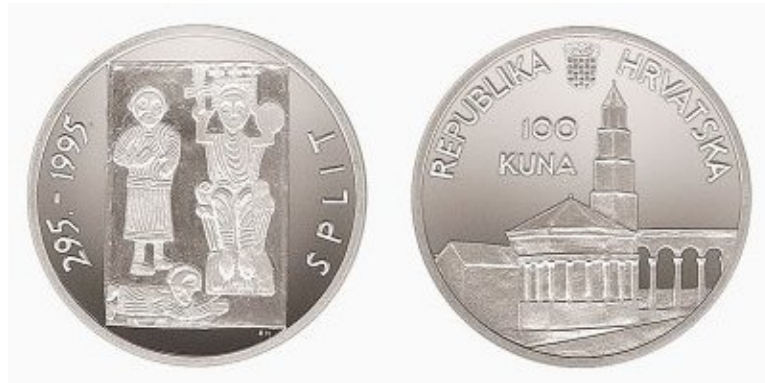
Abbildung 4: Sondermünze 1700 Jahre Split. 23.11. 1995.