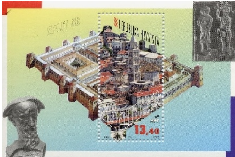
Abbildung 2: Briefmarke 1700 Jahre Split. 20.04.1995.