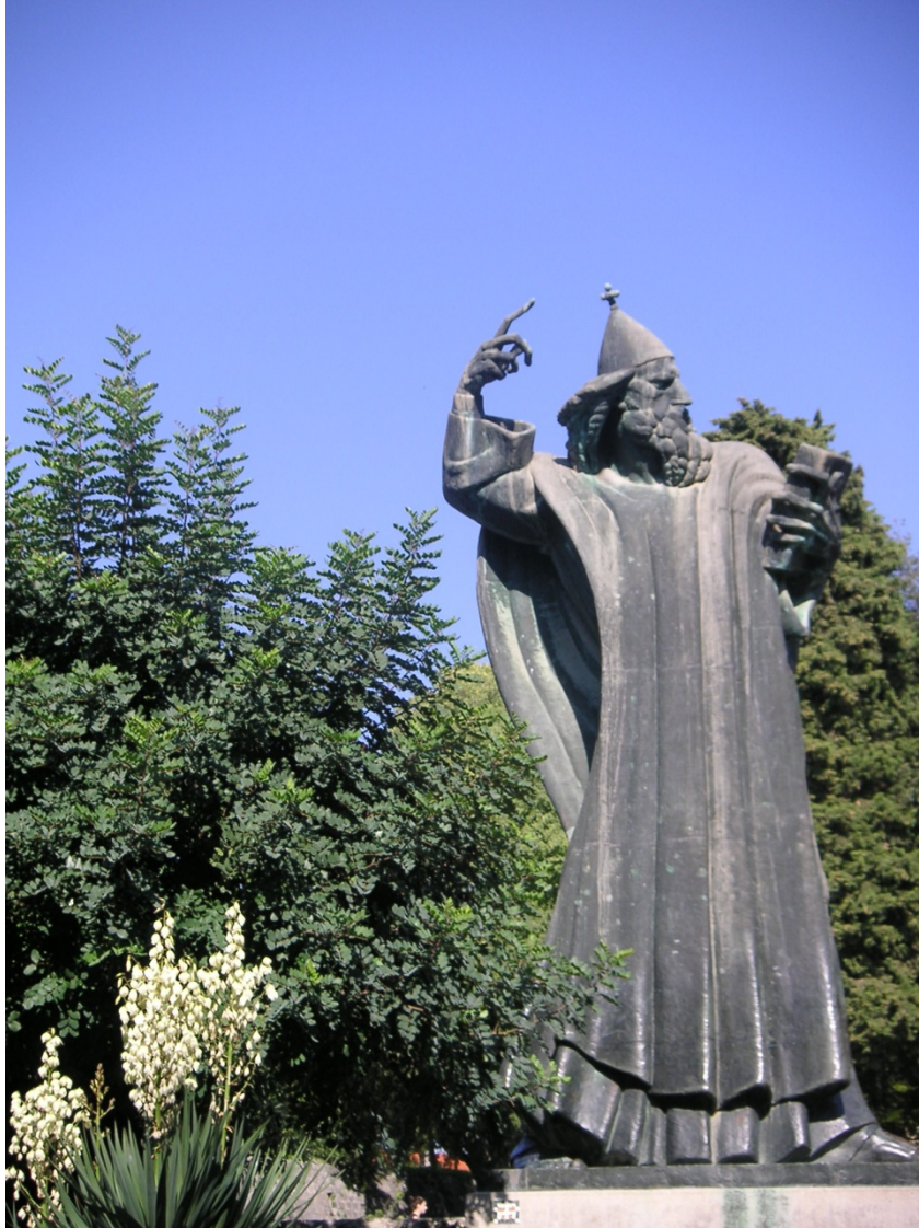
Abbildung 5: Ivan Meštrović, Gregor von Nin