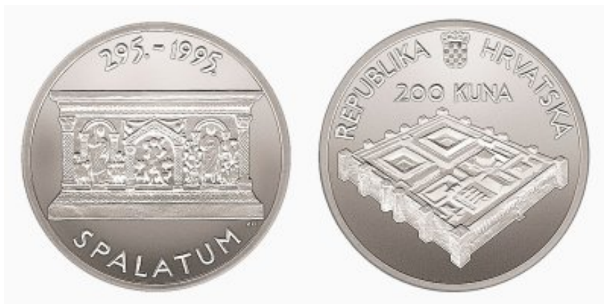
Abbildung 3: Sondermünze 1700 Jahre Split. 23.11. 1995.