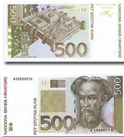
Abbildung 4: 500 Kuna Schein.